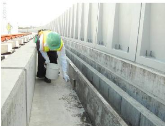
（鉄道高架橋施工状況）

注）上塗りやプロテクション SC コンセントレートを塗布する場合は、弊社担当に御相談下さい。