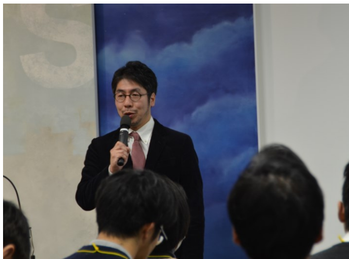
—CD 研究所第 1 研究部藤枝よりアドバンスカラーへの取組みを紹介—

自動車分野においては、これまでも弊社が提案した多くの色が実際に自動車に塗装され、街の彩りに花を添えています。今回発表させていただいた「グローバルアドバンスカラー」では、長年に亘り当社が行ってきた各国の色材や色彩の調査を踏まえ、世界や社会の情勢やファッション・インテリアの流行を参考に、入念なコンセプト作りを行い、世界市場をターゲットにした色彩提案を行いました。