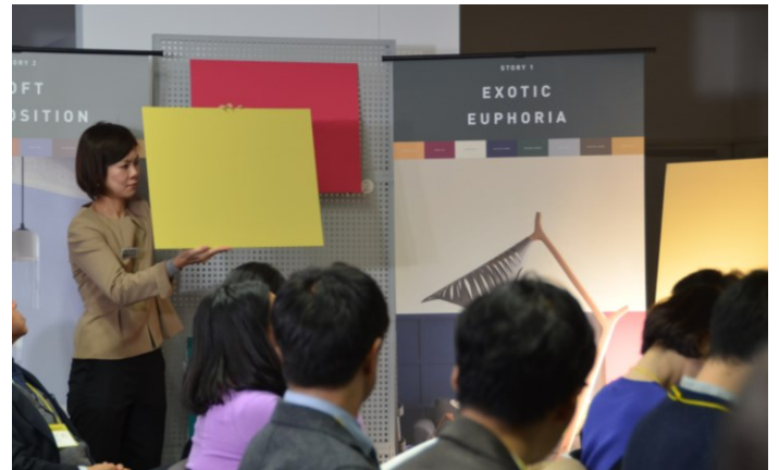
—4つのテーマに沿って各8色をご提案しました—