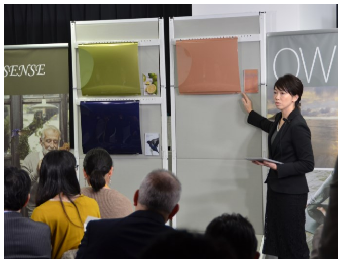
—「幸せとは何か」を問う時代から見えてきたカーを紹介—