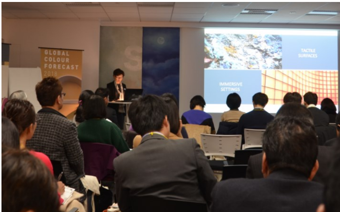
—約 60 名の方に参加いただきました—

建築分野に向けた「関西ペイント グローバルカラーフォーキャスト 2018」では、世界を取り巻く不安定な社会情勢の中で、「人と人との繋がり」や「多くの人の共感」といった感覚を重視し、人々の生活の中に「夢や希望」、「落ち着きや安定」といった快適空間演出に役立つ色彩やデザインをテーマに掲げ、ファッションやインテリアデザインのトレンドをじっくりと見極めた上で、弊社が自信を持って推奨するトレンドカラーを提案させていただきました。