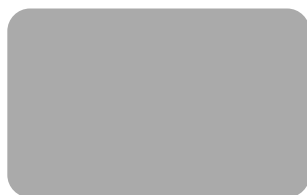
グレー (N-7 近似)